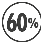
AHORRO DE AGUA*